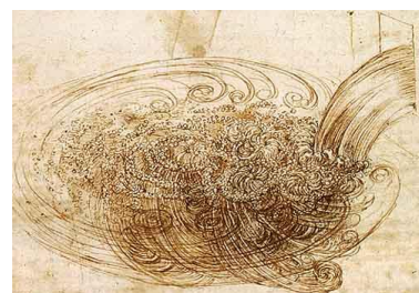
図2 ダ・ヴィンチが描いた乱流

約500年前、レオナルド・ダ・ヴィンチは乱流のスケッチ（図2）を描き、“渦”こそが乱流を理解する重要な鍵であると指摘しました。しかしこの渦は、定義も存在も不明瞭で、ダ・ヴィンチの提案は十分には確認されていないのが現状です。